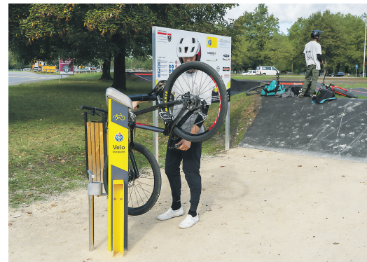
Mit dem Sponsoring von Pumptracks und Veloreparaturstationen unterstützt der TCS die Mobilität der Jüngsten.

Zum schweizweiten Ausbau benötigt Jedsy eine Absicherung. Diese Rolle übernimmt der TCS. Im seltenen Fall einer ungeplanten Drohnenlandung – das kann zum Beispiel aus Flugverkehrsgründen vorkommen – wird die TCS Patrouille kontaktiert. Die Landungen finden auf vordefinierten, geschützten Ausweichplätzen statt. Die Patrouilleure sorgen für die Sicherheit der Drohne und bringen bei