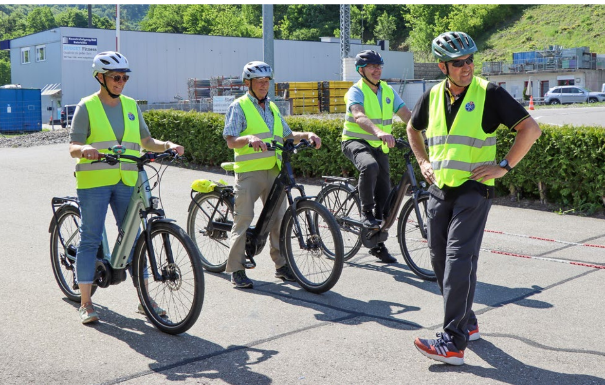
E-Bike-Fahren will gelernt sein – kein Problem mit unseren Instruktoren!