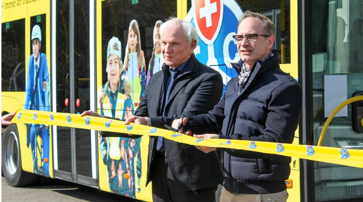
Einweihung des neu beschrifteten PostAuto-Busses im TCS-Kleid.