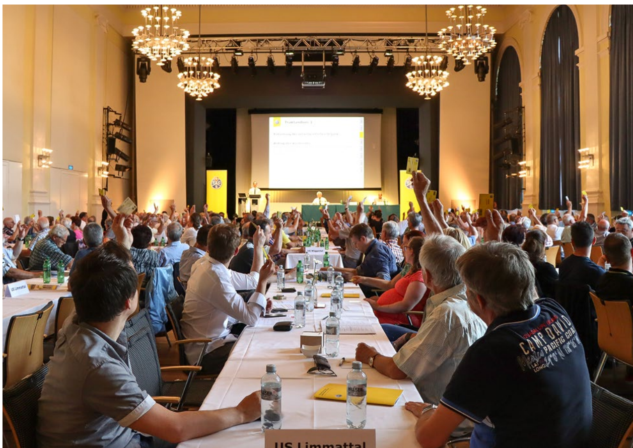
Delegiertenversammlung der TCS Sektion Aargau im KUK Aarau.