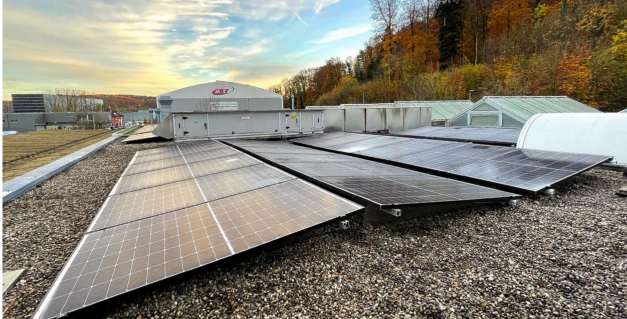
Solarpanels mit einer Gesamtfläche von 340 m 2 auf den Dächern der TCS Sektion Aargau in Birm.