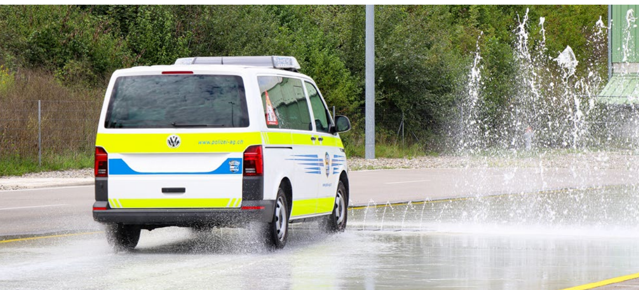
Die Polizei kommt am Weiterbildungskurs auf der Fahranlage im TCS Fahrzentrum Frick ins Schleudern.