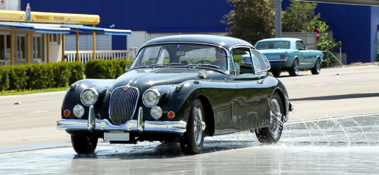
Auch Oldtimer-Besitzer nutzen das Fahrtrainingsangebot in Frick.