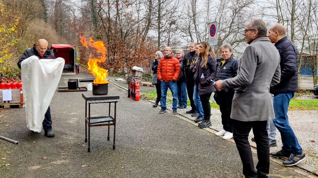
Weiterbildung der TCS Mitarbeitenden zum Thema Sicherheit.