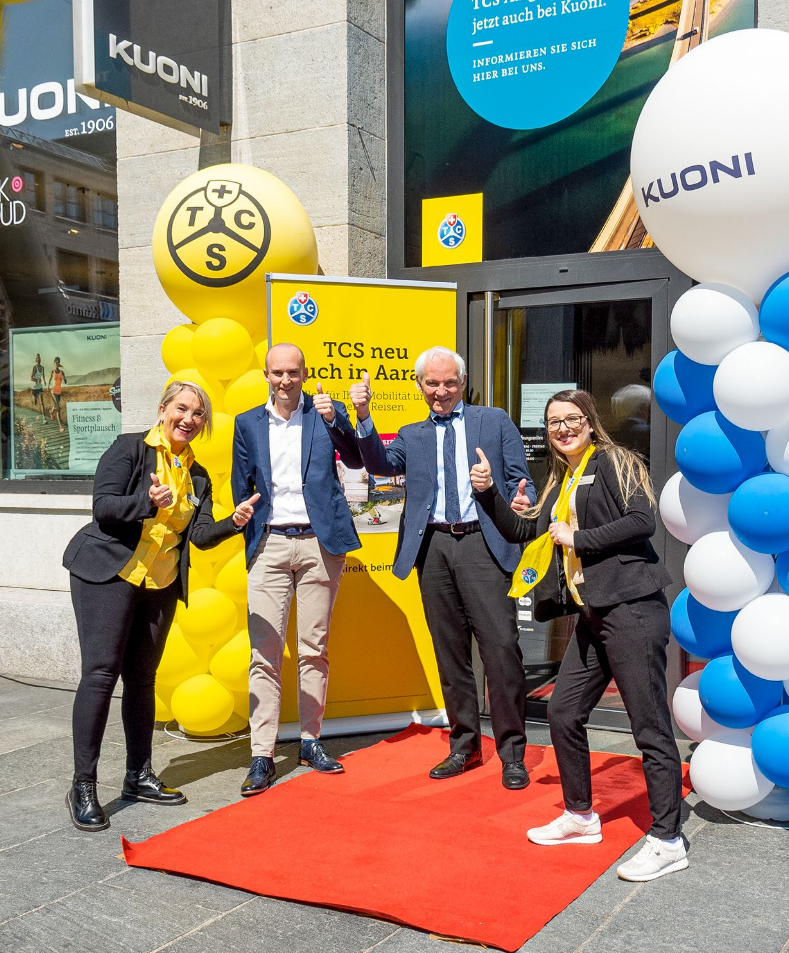
Historischer Moment für die TCS Sektion Aargau: Neueröffnung der Kontaktstelle Aarau.