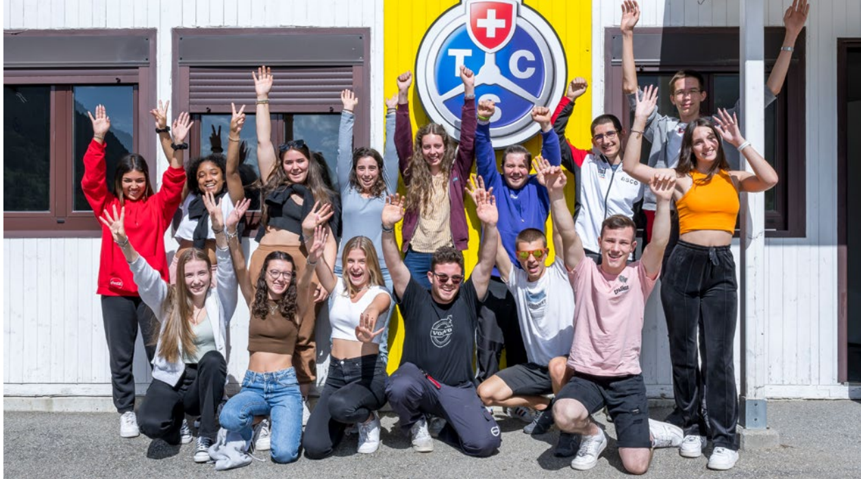
TCS Drive Camp in Scruengo TI.