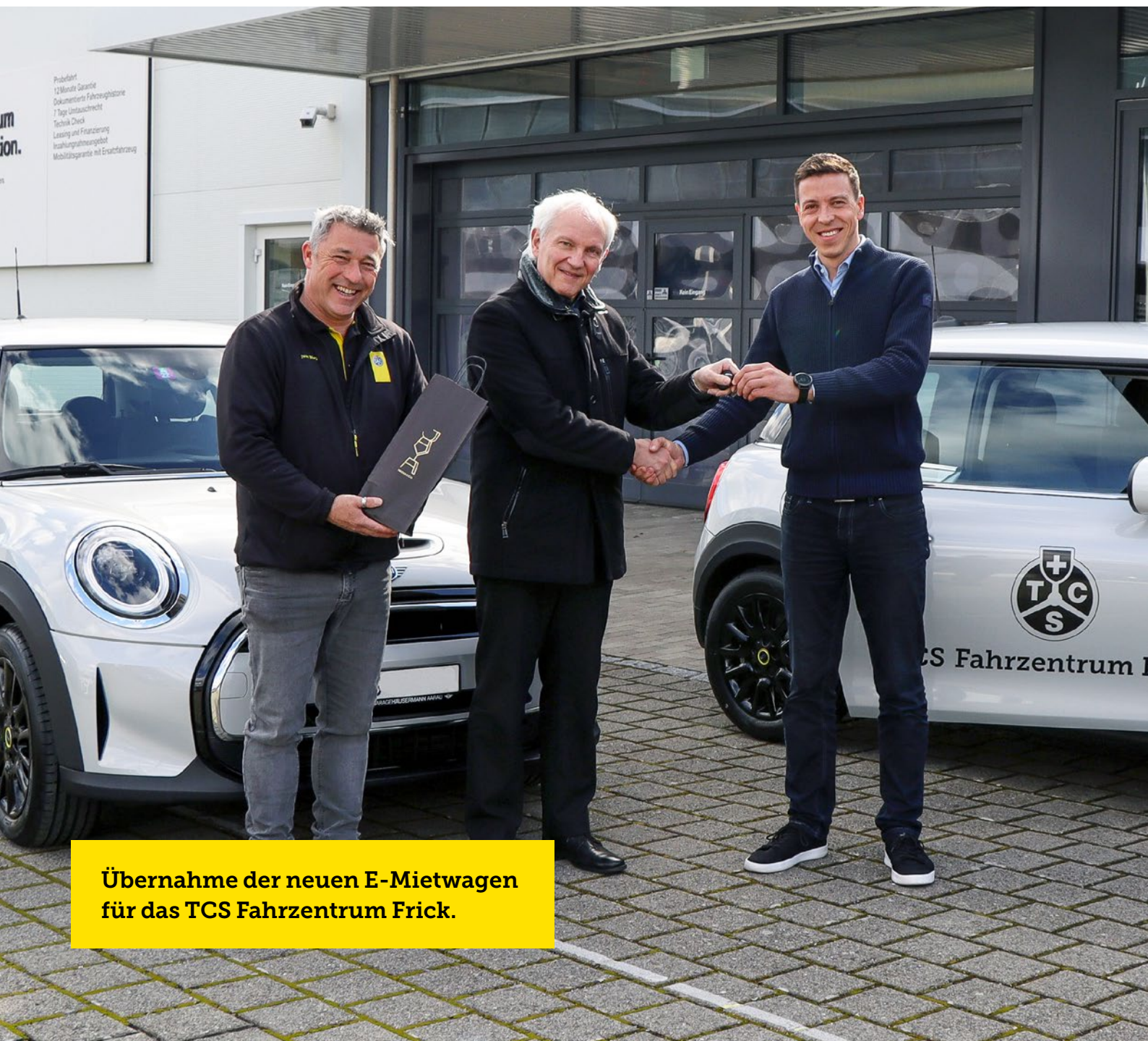
Übernahme der neuen E-Mietwagen für das TCS Fahrzentrum Frick.