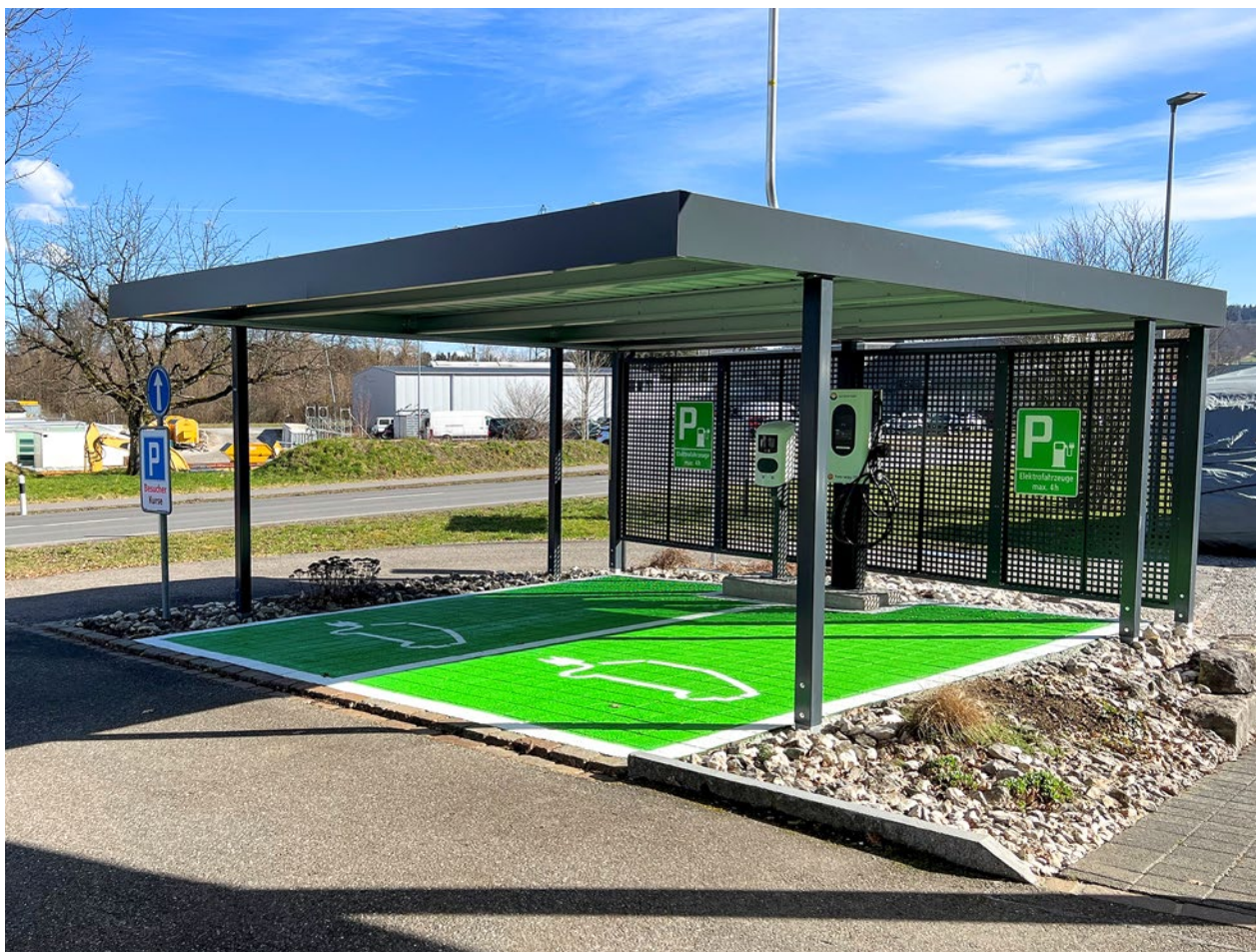
Carport mit eigener PV-Anlage und Ladeinfrastruktur für bidirektionales Laden.