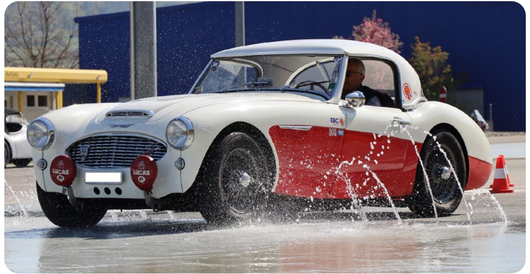
Fahrtrainings mit dem Oldtimer sind auch immer ein Austausch unter Gleichgesinnten