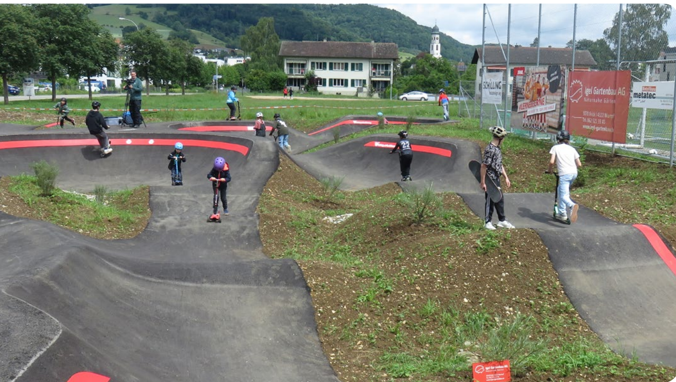
Pumptracks – Verkehrssicherheit spielerisch erleben – der neue Pumptrack in Frick zieht Gross und Klein in Scharen an