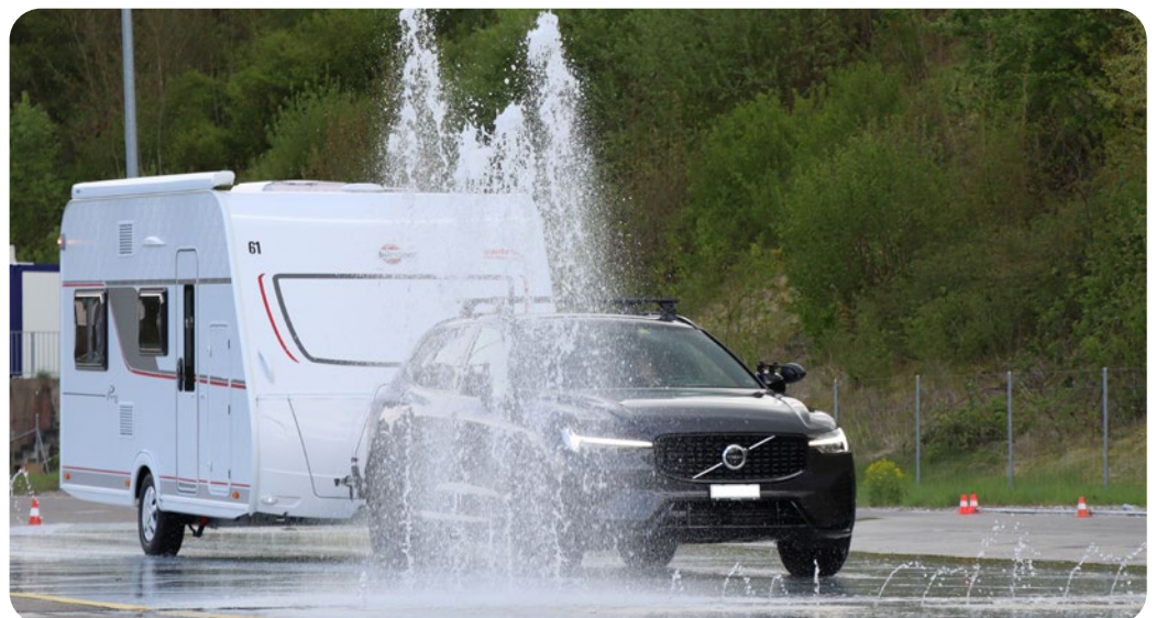
Auch mit dem Wohnwagen muss man in jeder Situation richtig reagieren können