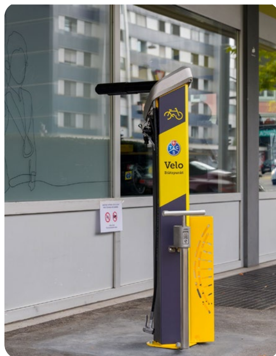
TCS Velo-Reparaturstation in Baden