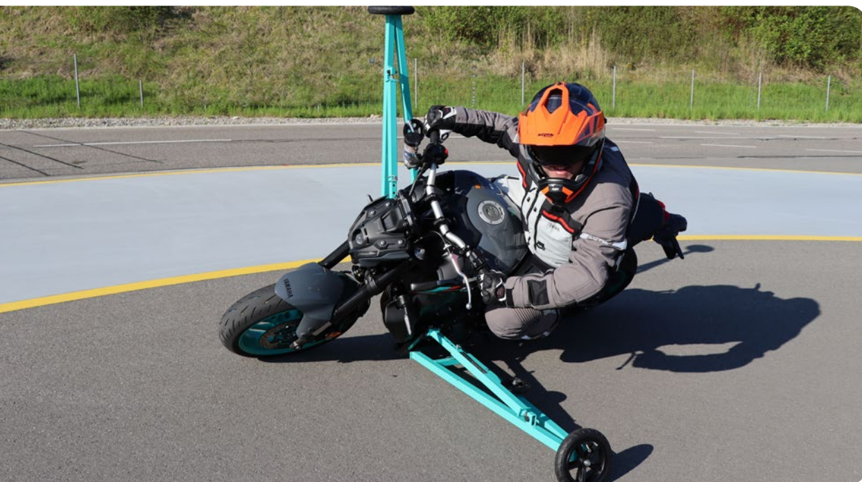
Die Schräglage mit dem Motorrad macht viel Spaß – sofern man geübt ist