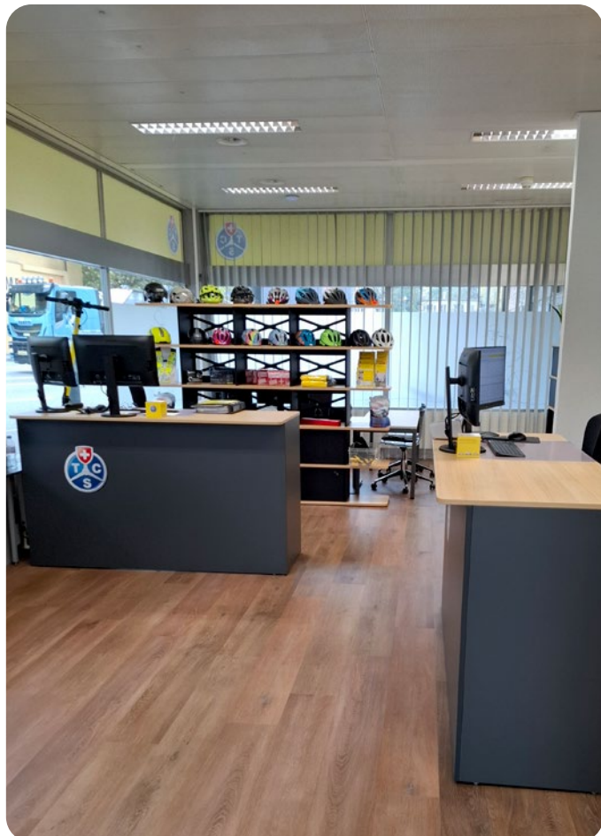
Der Verkaufsraum in der neuen TCS-Kontaktstelle in Baden