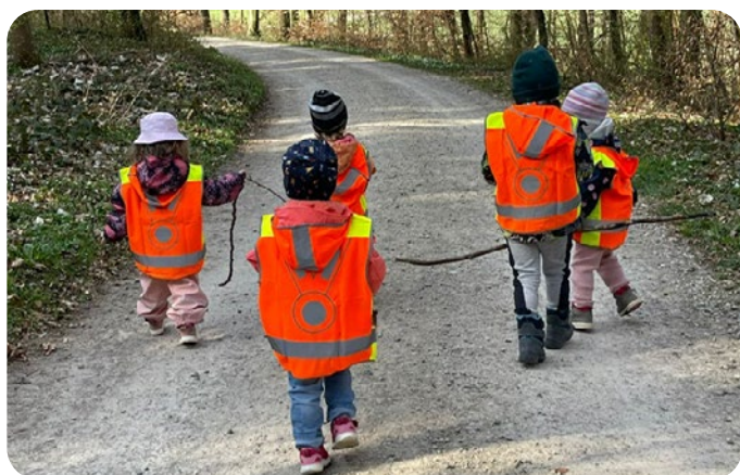
Gut sichtbar unterwegs – Kinder in TCS-Westen