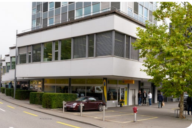
Aussenansicht der neuen TCS-Kontaktstelle in Baden