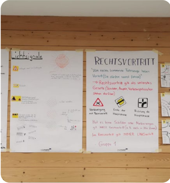
Theoriezusammenfassung im TCS Drive Camp