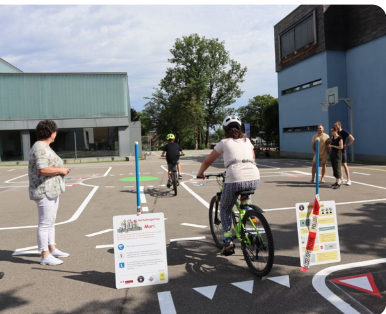
Verkehrsgarten «Badweiher» in Muri