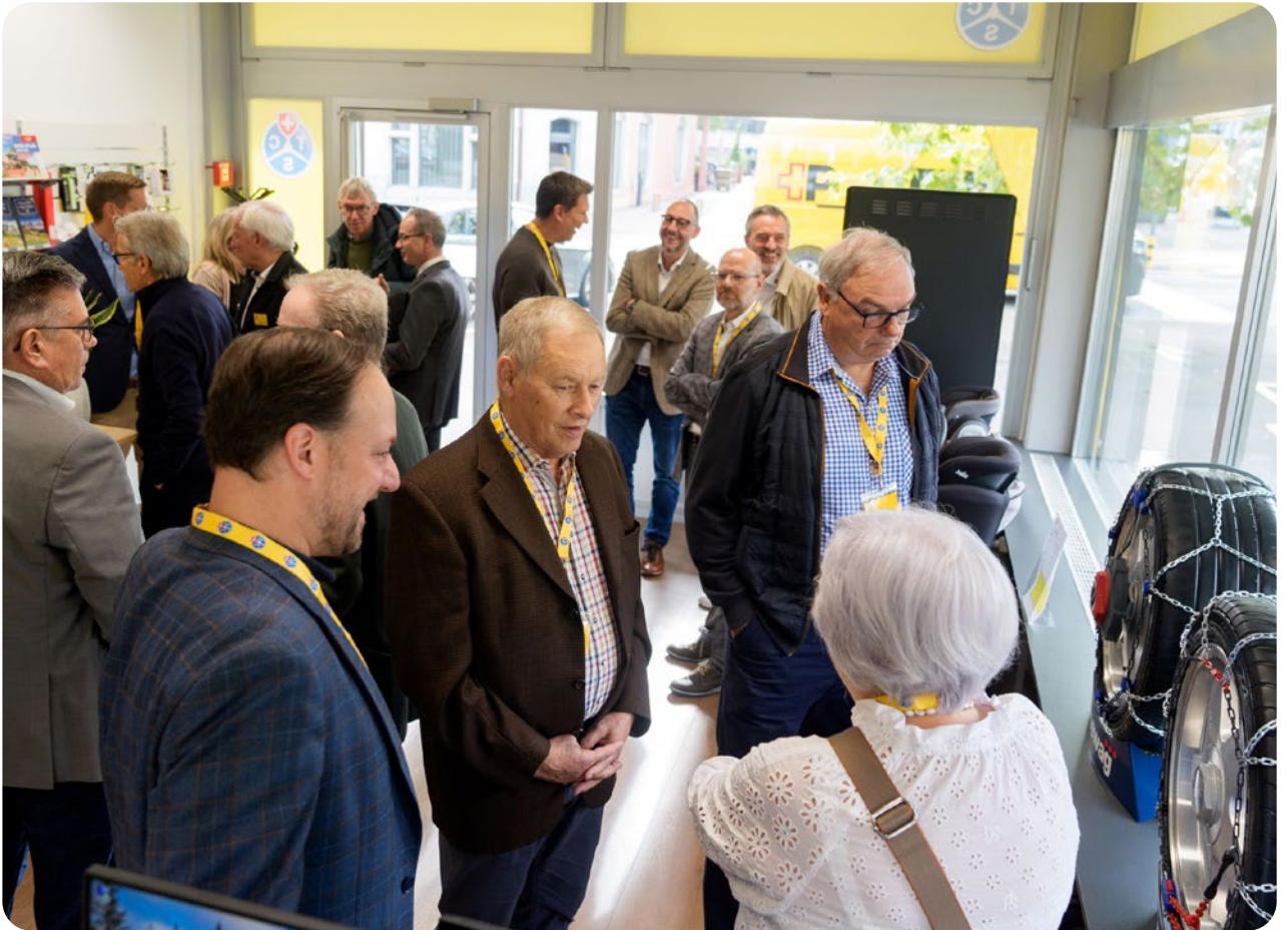
Eröffnungsanlass in der neuen TCS-Kontaktstelle in Baden