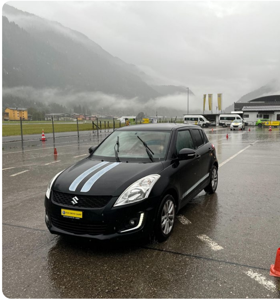
Auch im Tessiner Regen üben sich die Teilnehmenden des TCS Drive Camps