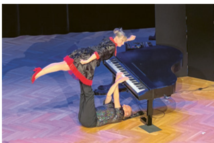
Die lustige Show des Duos Full House