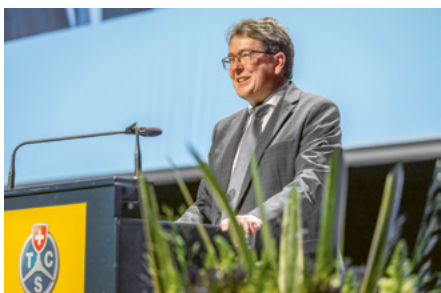
Bundesrat Albert Rösti