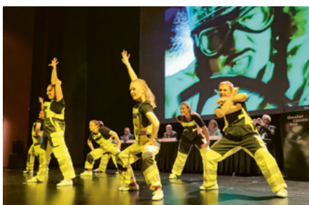
Die Retro Dance Company in Action