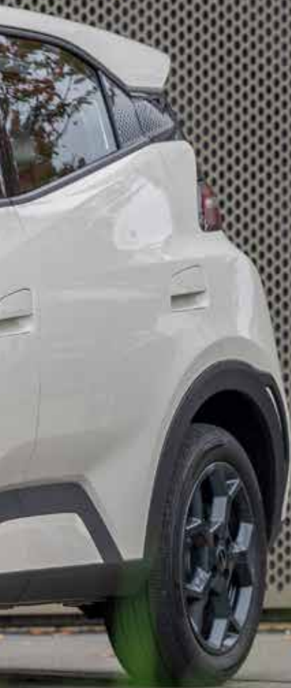
La BYD Dolphin Surf est une citadine compacte et agile.

Le concept de commande à molettes est original et pratique.