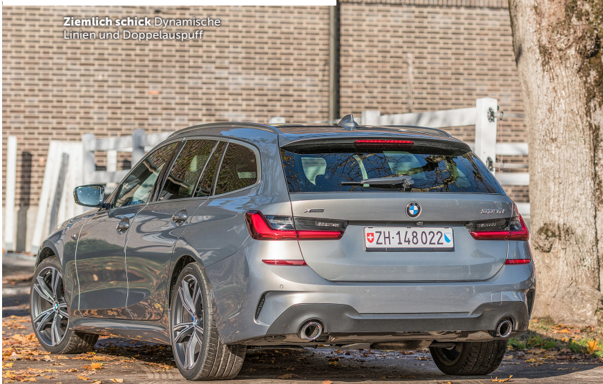
Ziemlich schick Dynamische Linien und Doppelauspuff