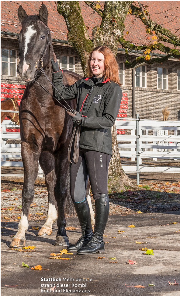
Stattlich Mehr denn je strahlt dieser Kombi Kraft und Eleganz aus