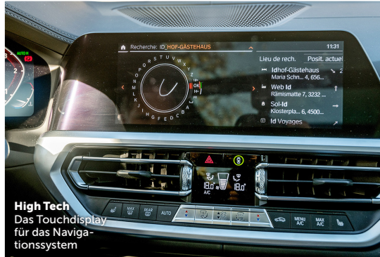
High Tech Das Touchdisplay für das Navigationssystem