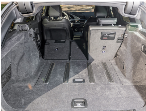
Ben configurato, il bagagliaio con pianale basso.