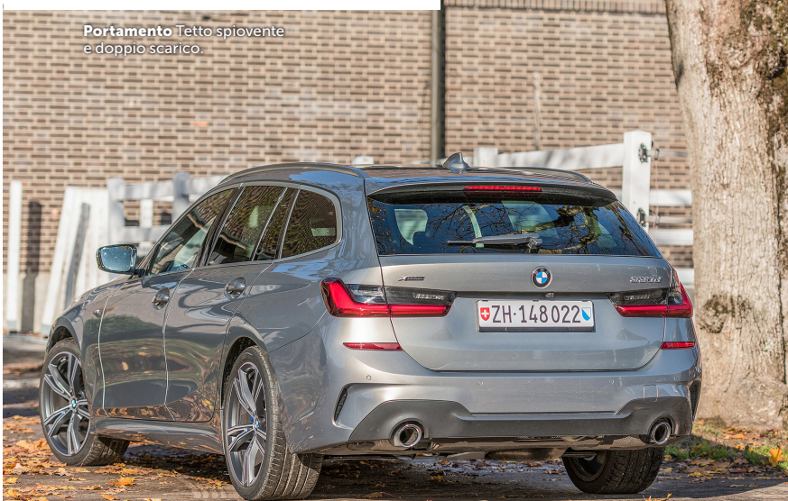
Portamento Tetto spiovente e doppio scarico.