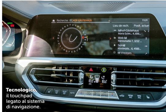
Tecnologico. il touchpad legato al sistema di navigazione.