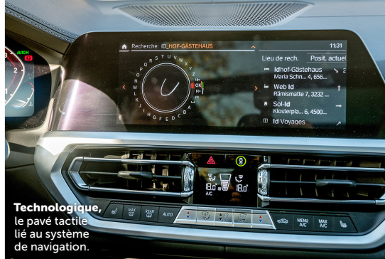
Technologique, le pavé tactile lié au système de navigation.