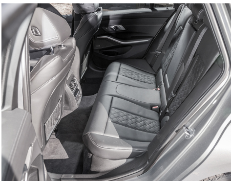
Dans la norme, l'espace de la banquette.