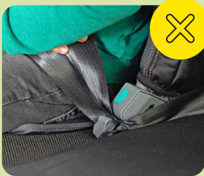
Yanlış kemer yönlendirmesinde çocuk en iyi şekilde korunmaz.

Her iki çocuk emniyet sisteminden (KRS) biri yanlış kullanılmakta ve her üç sistemden birinde eksiklikler ciddi boyutlara ulaşmaktadır. Bu durum,